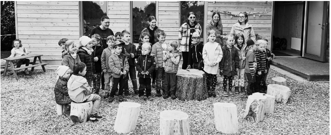
Schwungvolle Eröffnung der Kindergartenkinder

Der Waldkindergarten an der Bergreute wurde feierlich eingeweiht.