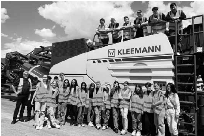
Klasse 9b bei der Fa. Kleemann

Mit den fünf PAG-Tagen in diesem Schuljahr haben wir unsere Schülerinnen und Schülern hoffentlich wieder ein Stück mehr fürs Leben vorbereitet und sie gemäß unseres Mottos stark werden lassen fürs Leben.